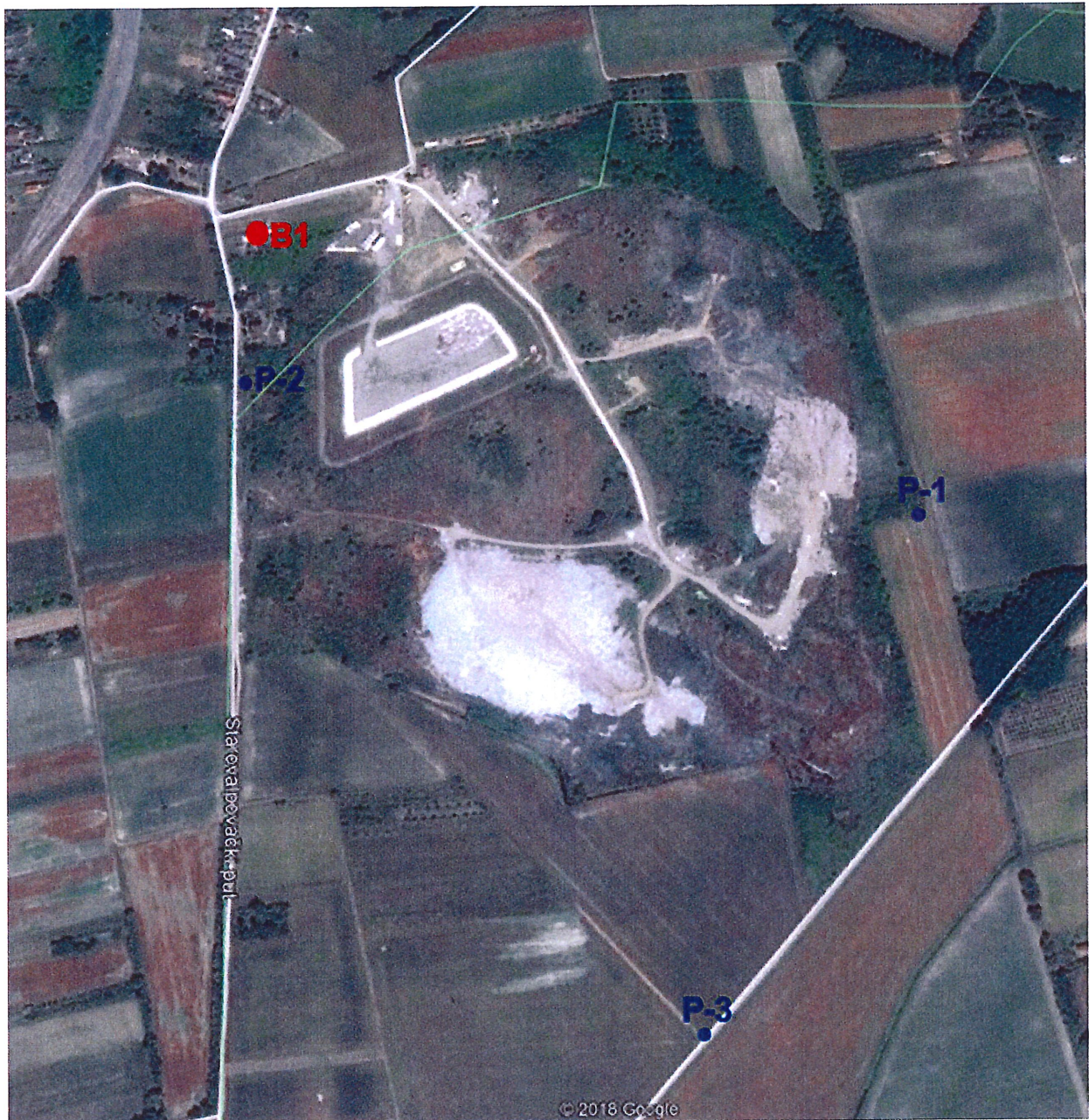
Prilog 3. Ortofoto karta s prikazom mjesta uzorkovanja voda i mjerenja intenziteta buke